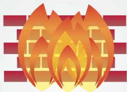
Firewall, software de seguridad para Internet