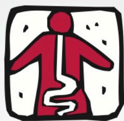
Píldora que se digiere que contiene una cámara que puede detectar cancer