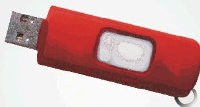
USB Flash Drive Disk On Key