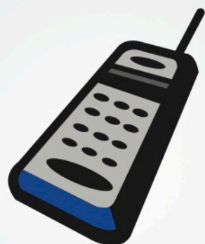
Tecnología para teléfonos celulares

Los siguiente productos fueron desarrollados en Israel