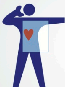
Diagnóstico de análisis de sangre para detectar posibles ataques al corazón por teléfono