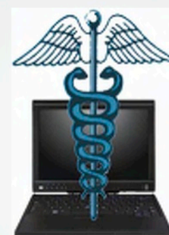
Antivirus para PC